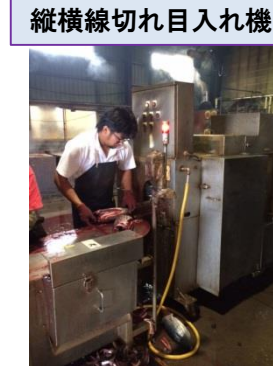
縦横線切れ目入れ機