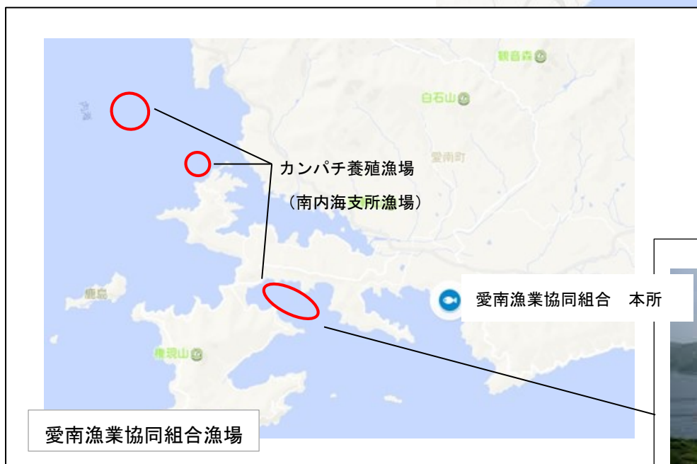
カンパチ養殖漁場 (南内海支所漁場)