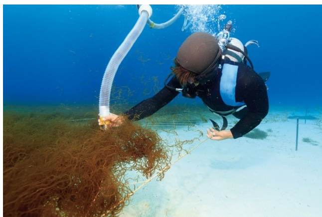
モズク収穫の様子