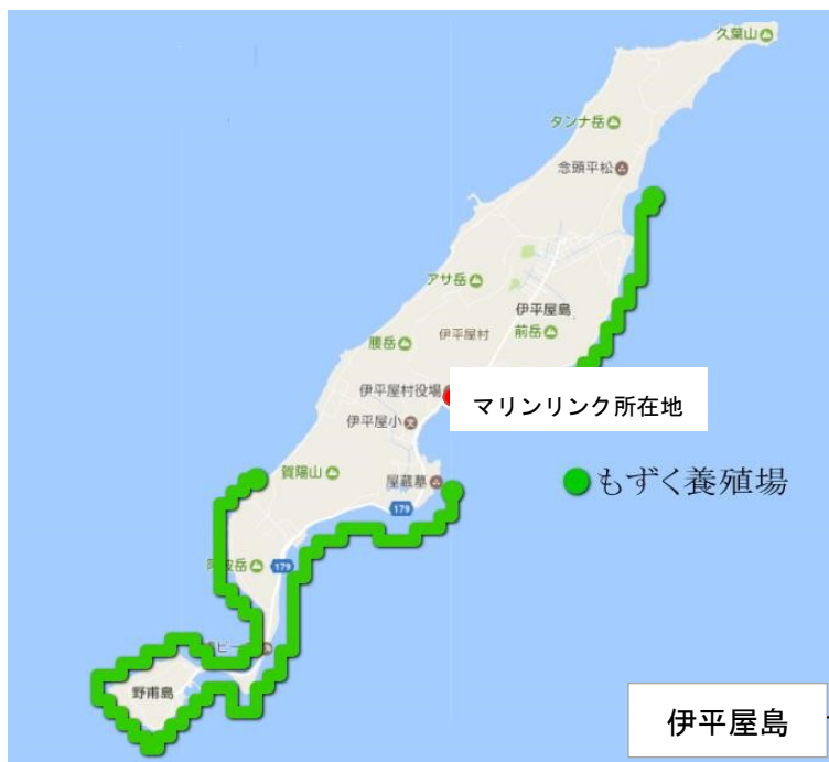
Marine Link 株式会社漁場図