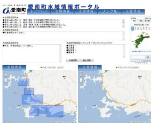
愛南町水域情報ポータルのページ

※ COD（化学的酸素要求量）：代表的な水質の指標の一つ。水中の被酸化性物質を酸化するために必要とする酸素量。水中の主な被酸化物質は有機物であるため、CODが高い＝有機物量が多い傾向にあり、水質が悪化しているといえる。