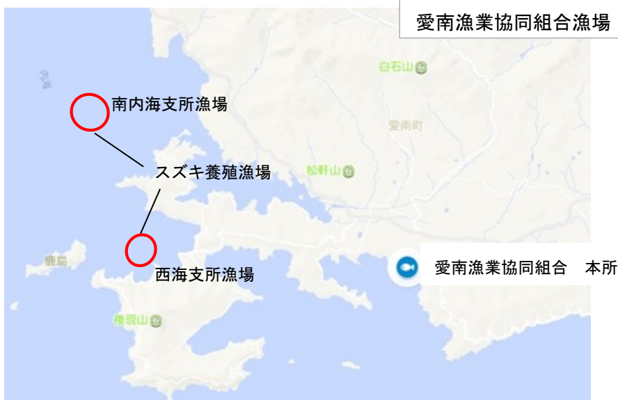
愛南漁業協同組合漁場