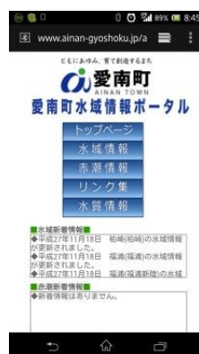
タブレットの画面