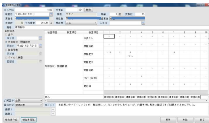
魚版電子カルテシステム